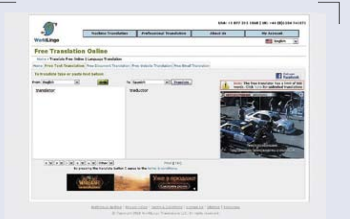
■ Worldlingo Multilingual Translator