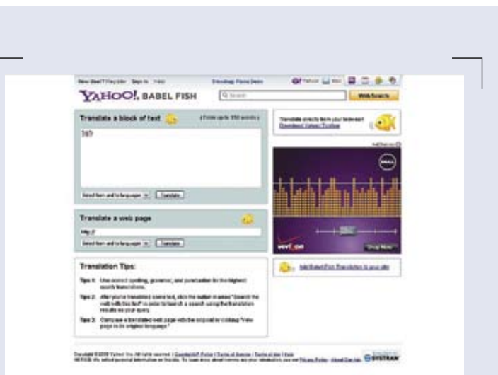
■ Babel Fish Translation